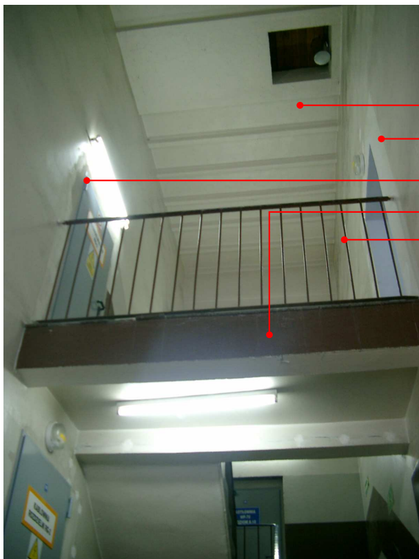
FOTOGRAFIA_7 : Klatka schodowa pionu administracyjnego .